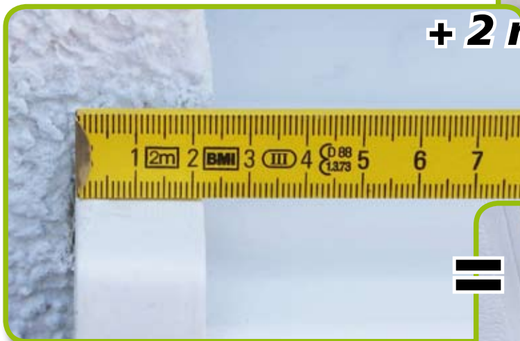
Breite Putzkante Bordprofil